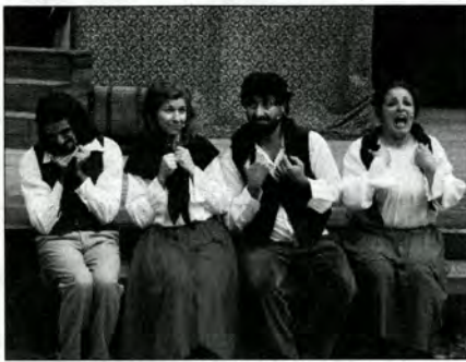
Una precedente esibizione della compagnia